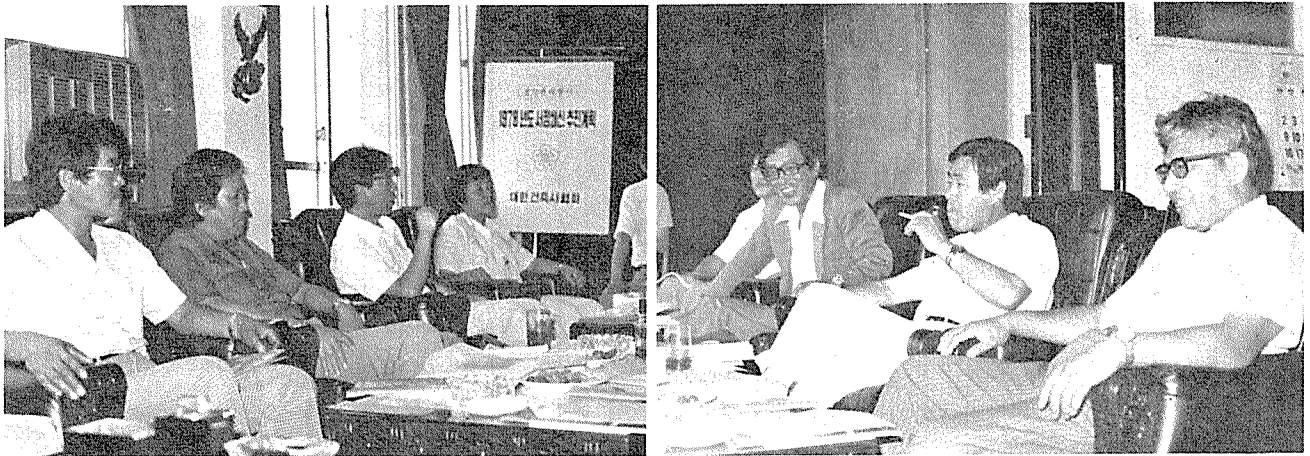
제 7회 편찬위원회의 위원전원참석