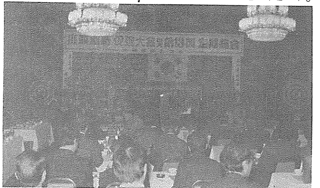
서정채신 축진대회 광경