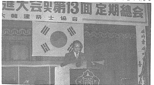
건설부장관의 말씀을 대독하는 주택국장