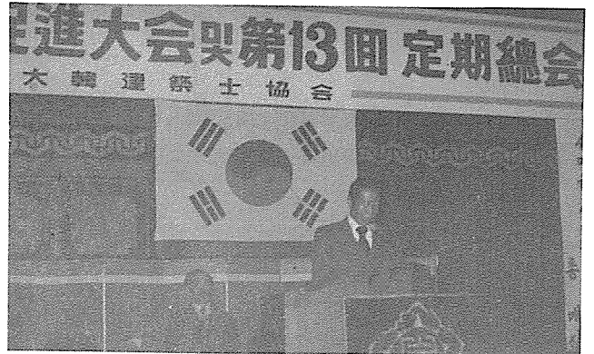
개회사를 하는 회장

이때 시간(20:40分) 회장선출에 있어 그 방법으로서 과반수나 종다수나를 놓고 다시 의논 끝에 종다수 결의 결선에 들어갔다. (20:50分)