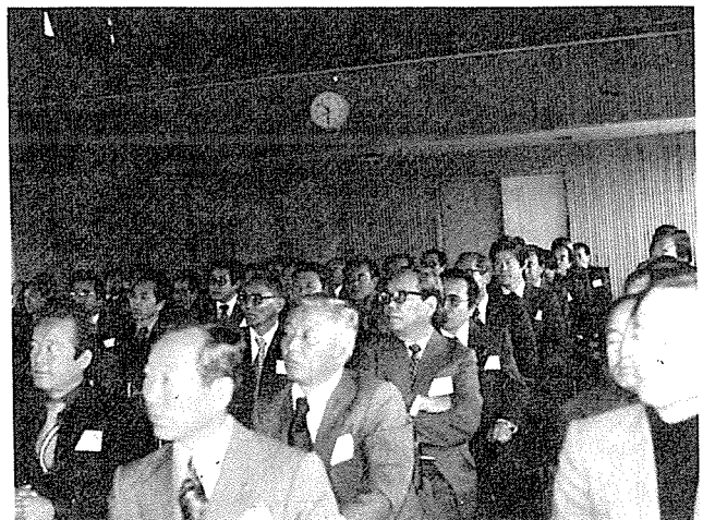
교 과목을 경청하는 회원