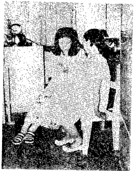
〈산전진찰수 위해 일산부탄 등극하는 보건요원〉

1974년 9월 용인군 보건소의 모든 직원을 다목적 활용키 위한 특별 교육을 실시하였으며 1974년 10월에는 최초로 1개면의 보건지소장(공의)과 3명의 보건요원의 훈련을 실시하였다. 나머지 10개면은 점차적인 요원 훈련에 들어가서 1975년 11월말에 완전히 11개면의 교육이 끝나 다목적 사업이 실시되었다. 이러한 새로운 보건사업의 운영에 있어서 보건소 Nursing Unit의 기술적인 감독과 지시는 보건지소 요원에게 절대 필