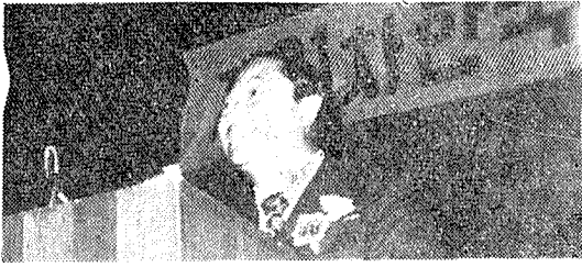
(환영사를 하는 吳聖植 국립중앙도서관장)

간의 負債가 있습니다. 다행히 現在 會費納入成績이 좋아서 대부분 償還된 것으로 알고 있습니다. 앞으로 協會의 財政難 打開을 위하여 會員 여러 분들의 보다 積極的인 協助가 있어 주시기를 부탁드립니다. 그리고 어려운 中에서도 오는 76年度에는 국제도서관협회연맹회의를 우리 協會가 誘致하여 서울에서 開催키로 되었습니다. 이 국제회의를 誘致하기 까지는 많은 어려움이 있었던 것으로 알고 있으며 모든 難關을 克服하면서 手苦하여 주신 여러 분들에게 이 자리를 빌어 감사사를 드리지 않을 수 없습니다. 決算報告에 대하여 質問事項이 없으신지요.