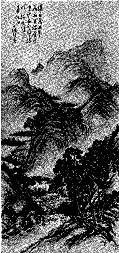
山水圖 (1910年代) 小琳 趙錫晉 作

결국 小琳의 藝術을 한 마디로 말한다면 琳田 趙廷奎의 것과 吾園 張承業의 것 그리고 그것을 소화시킨 이른바 小琳의 것의 總和라고 할 수 있다. 그의 初期에 영향을 준 琳田은 1771년(正祖 15년)生으로 檀園 金弘道の 영향을 받은 작가로서 山水와 魚蟹가 뛰어났다. 따라서 小琳의 作家 形成 以前의 幼年期를 이 작자에게 배움 받은바 있는 관계로 小琳도 魚蟹圖나 山水에 있어서는 琳田의 인 筆法이 다분히 밑바닥에 깔려 있다.