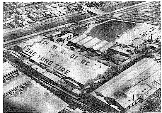
<大英타이어 城南工場 全景>