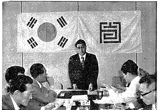
市道支部長會議 光景