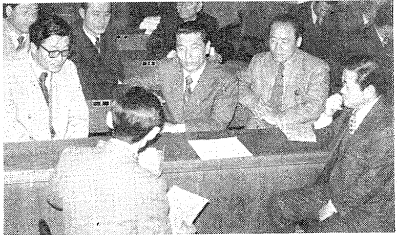
(熱烈 熱議를 하고 있는 評議員會 光景)