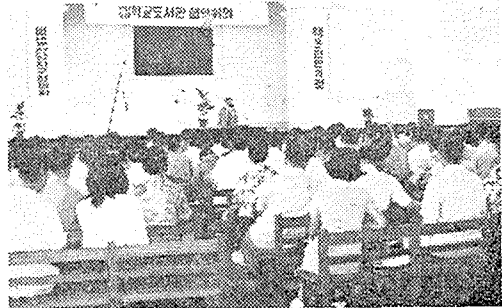
(학교도서관 협의회 광경)

본 협회 산하 전남지구협의회에서는 침체한 학교도서관의 발전을 도모하고 전국적으로 메아리치고 있는 새마을 운동에 있어서 학교도서관이 담당할 역할을 모색하려는 뜻으로 도내 학교도서관 협의회를 개최하였다고 한다.