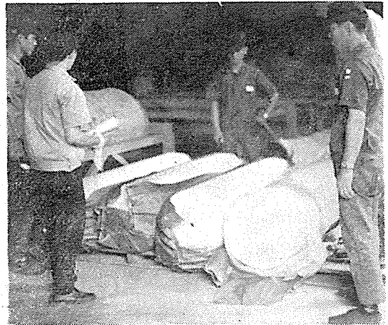
사진 : 사용 직전의 화학섬유질 토핑용 라이너지