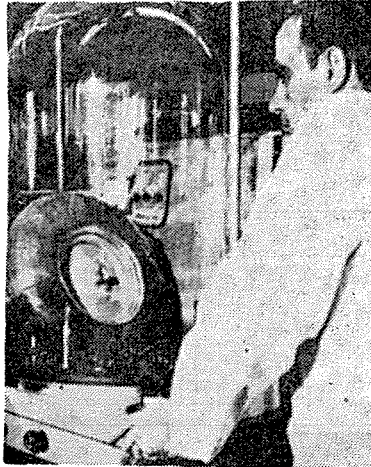
寫眞은 지난 2月 7日 달에 着陸한 아폴로 14號에서 運搬用으로 使用된 GY의 月面 타이어 斷面과 그 運搬用車의 模型