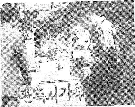
(지역주민을 찾아 봉사하는 순회문고)

산층이하의 세대를 일일히 방문하여 그 가정의 독서층을 조사하고 순회문고의 의의를 인식시켜 주므로써 문고운영에 큰 도움을 가져왔다.