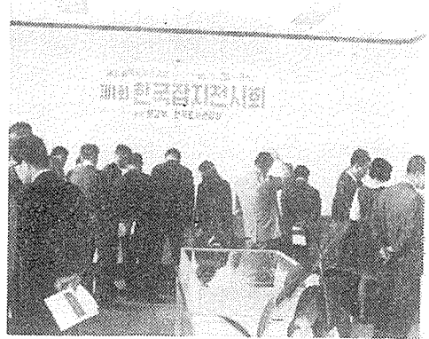
(잡지 전시회 광경)