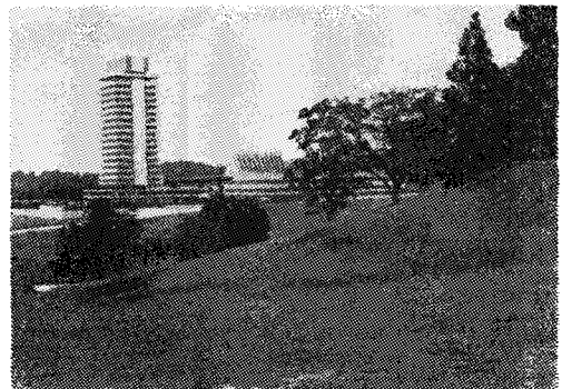
「쿠알라룸푼」에 있는 馬來聯邦 國會議事堂