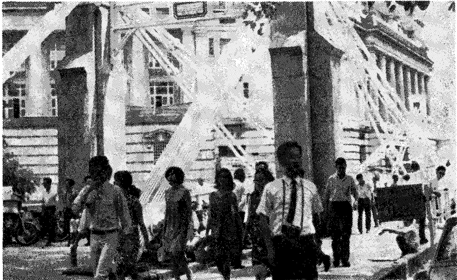
싱가폴 市街를 둘러보고 있는 筆者

「東南亞=中國人天下」라고 부를수 있으리만큼 東南亞細亞의 구석구석마다 華僑들이 侵透하여 商權을 은통 掌握하고 있었다. 이러한 華僑商權下의 東南亞細亞에 우리 韓國이 어떻게 뚫고 들어가 據點을 確保하고 恒久的 市場構築을 達成할것인가 하는것이 이번 21日間의 東南亞細亞巡訪旅行中에 우리의 머리를 恒時 떠나지 않은 課題였다.