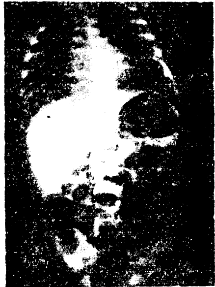
제 1도 우측상엽에 약간의 폐침윤이 보이며 복부에 위장관내의 기체를 볼 수 있다.