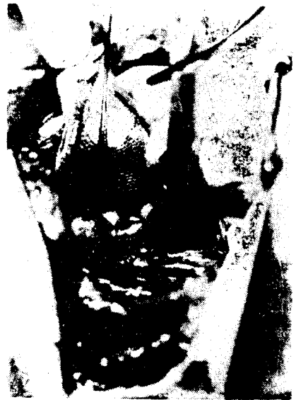
제 3 도 黑色 乾인사 부위는 喪失된 상부식도이며 고무 밴드로 乾인된 부위는 하부 식도로써 하부식도 上端에 氣管食道瘻가 형성되어 있다.

手術後 經過는 比較的 良好하였고 切開部位에 瘡傷感染이 생겼으나 곧 治癒되었다. 第 2 日에 胃瘻孔을 通하