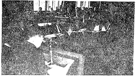
李丙熙 博士의 基調演說