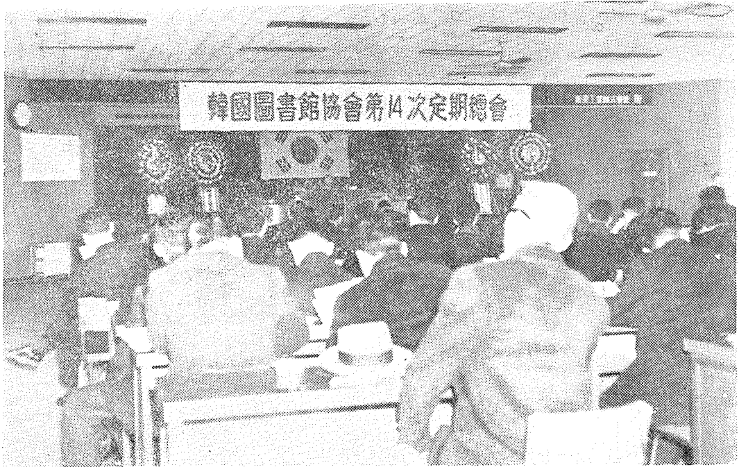
〈第14次 定期總會 開會式 光景〉