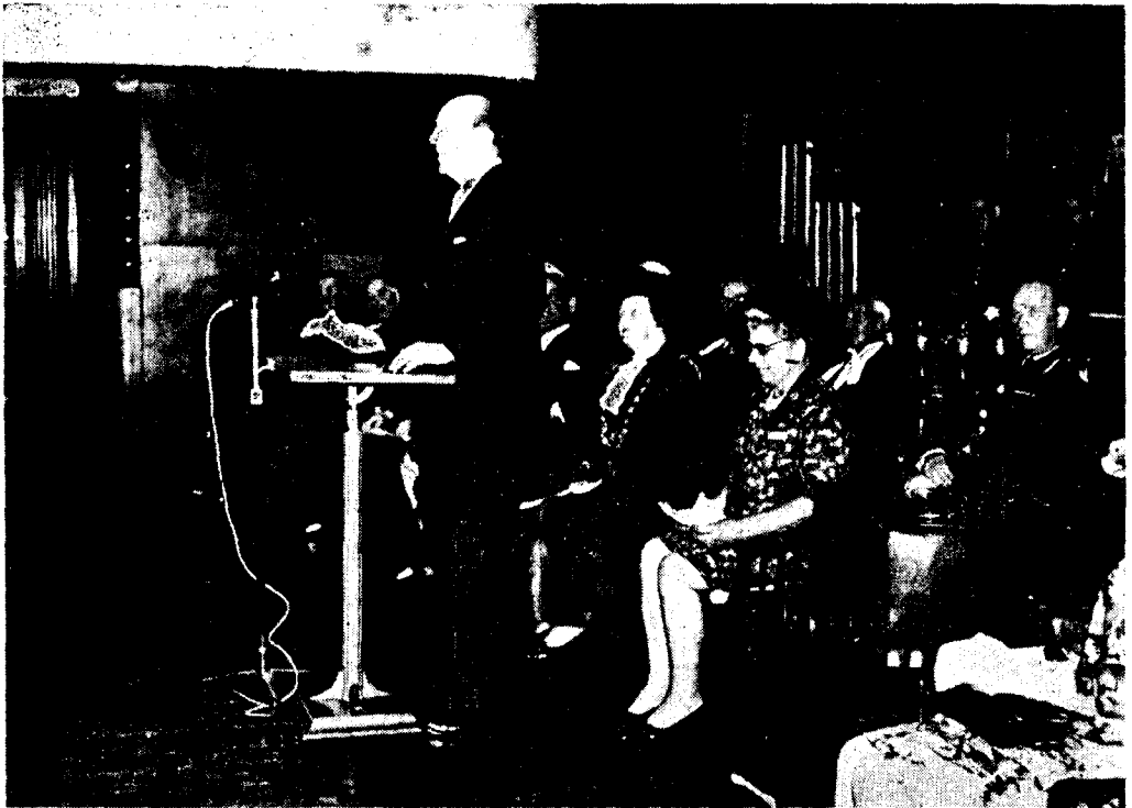
壇上의 來賓 (向해서 바른편에 앉은 분이 會長)