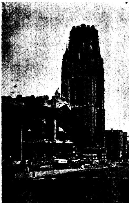
Bristol 大學塔 ('68年 會議場所)

5年前 파리會議에 이어 11回 國際會議는 英國 軍港인 브리스틀에서 개최되었다. 런던에서 一泊後 브리스틀行 기차를 탄 것은 7月 21日 오후 였다. 特別列車가 준비되었으나 조금 일찍 가기 위하여. 다른 車便을 이용하여 5時 30分에 目的地에 도착하였다. 마중 나온 英國 會員의 안내를 받아 내가 留宿할 寄宿舍인 Rodney Rodge 로 가는 도중 브리스틀 市廳앞을 통과하게 되었다. 市廳 廣場에는 30餘個國의 國旗가 휘날리고 있었다. 그 가운데서 태극기를 발견하였을 때 나는 눈시울이 뜨거워짐을 금할 길이 없었다. 이때까지 우리는 우리가 할 일을 다하지 못했었기 때문에 우리나라 國旗를 게양해 주지 않았었고 또 團體에 가입된 나라라 할지라도 會議場 안에 국기를 세우기는 했지만 이렇게 온 市民이 다 지나다니는 市廳廣場에 國旗를 세우기는 이