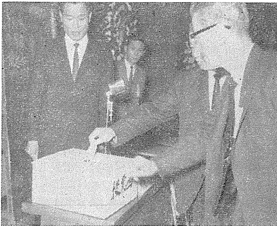
會長 選出 投票光景

이날 提案된 本會 諸規程 制定에 對하여는 理事會와 支部長會議의 連席會議에서 審議決定하도록 委任事項으로 決議하고 19時 閉會하였다.