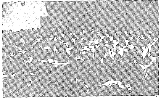
本會 創立以來 超有的 盛況을 이룬 第13次 總會의 片貌