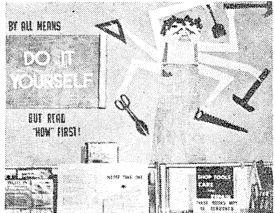
第2圖：工作關係資料를 展示하고 있다. 色 종이와 寫眞을 用해서 사람의 팔과 연모와 作業服을 만들어 내었다. —Wilson Library Bulletin에서.

클럽에는 登山班, 乘馬班, 速記班, 演劇班, 音樂班, 美術班, 書藝班, 寫眞班, 園藝班, 工作班, 手藝班, ... 等多種多樣한 同好人の 모임이 있다. 이들 中에는 教師의 指導力이 미치는 範圍 안에 있는 것도 있으나, 그렇지 못한 것도 많다. 또 個人的으로 볼 때에는 그 素質이나 技能이 教師보다 뛰어난 學生들도 많이 있다. 하지만, 特別活動에 關한 限 教師의 能力이 크게 問題되지 않는다. 왜냐 하면, 이 教育分野는 學生들의 自發活動을 어느 分野에서보다도 重視하고 있기 때문이다.