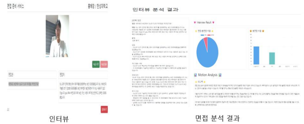
(그림 4) 서비스 UI 화면

본 연구에서 제안하는 면접 코칭 시스템은 Flask 기반의 웹 서비스로 구현되었다. 시스템의 작동 과정은 다음 네 단계로 구성된다: (1) 사용자 정보 입력, (2) 올바른 자세 가이드 제공, (3) 실시간 면접 진행 및 분석, (4) 종합적 피드백 제공. 실시간 면접 단계에서는 음성 인식을 통한 답변 텍스트화와 동시에 행동 분석이 수행되며, 면접 종료 후 언어적, 비언어적 요소에 대한 종합적인 분석 결과와 피드백이 제공된다.