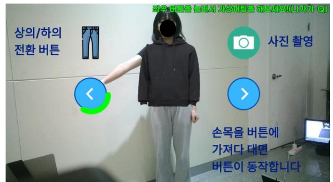
(그림 3) 결과 사진

상호작용 기능은 다음과 같다. 카메라 버튼을 통해 착용한 의상을 촬영할 수 있으며, 촬영된 이미지는 자동으로 가상 옷장 데이터베이스에 업로드된다. 또한, 좌우 이동 버튼과 상하의 전환 버튼을 이용하여 데이터베이스 내의 의류를 교체할 수 있다.