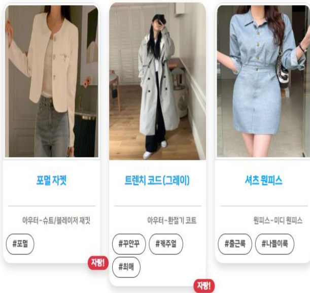
(그림 2) 가상 옷장

기존 연구에서는 옷의 이미지를 지정할 수 없었던 한계를 보완하여, FashionNet 에서는 사용자의 편의에 따라 가상 옷장 데이터베이스에 사진을 업로드할 수 있다. 업로드된 사진은 사용자의 선택에 따라 세멘틱 세그멘테이션[12]을 거쳐 저장되며, (그림 2)와 같이 사용자 개인 저장소에서 관리할 수 있다. 세멘틱 세그멘테이션에 사용된 Segment Anything(SAM) 모델은 IOU 90% 이상을 달성한 현재 최고의 모델이다.