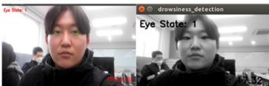
Fig. 3. Improved FPS on Jetson Nano