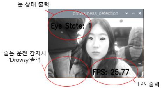
Fig. 4. Implementation Results

출력 화면은 운전자가 눈을 뜨면 1, 감으면 0으로 표시하는 상태 표시 텍스트와 FPS 확인을 위한 텍스트 그리고 운전자가 졸음운전을 하면 Drowsy라는 텍스트가 출력하도록 구현하였다. 운전자가 졸음운전 시 ChatGPT와 간단한 문제와 커피 메뉴 추천과 같은 간단한 소통을 확인하였다.