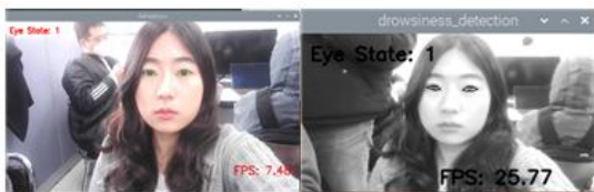
Fig. 2. Improved FPS on Raspberry Pi 4