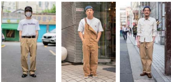
<그림 3> Shoes Navigator 실행 결과

그림 3 (왼쪽부터 입력, 출력 1, 출력 2) 처럼 사용자가 입력한 상하의에 따라서 비슷한 코드를 추천해주게 되고 사용자는 이를 통해서 원하는 신발의 종류, 악세사리 등 다양한 정보를 얻어 자신의 코드에 도움을 받을 수 있다.