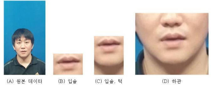
(그림 3) 검출된 관심 영역.

추출된 각 관심 영역 집합을 이중 선형 보간법을 사용해 너비와 높이를 130 * 100 화소 크기로 조정했다. 검출된 관심 영역들에서 MATLAB 을 사용해 그레이 레벨 변화량 특징을 생성하고, 원본 데이터에서 입술을 근사화한 특징을 생성했다. 생성된 특징을 MATLAB 을 사용해 특징 결합 및 결합된 특징에 대한 ISOMAP 차원 축소를 수행했다. 최종적으로 생성된 관심 영역별 특징에서 각 단어 데이터 군집에서 동적 정합으로 가장 중심에 있는 데이터를 템플릿으로 결정하고, 결정된 템플릿을 기준으로 하여 단어별 인식률을 평가했다.