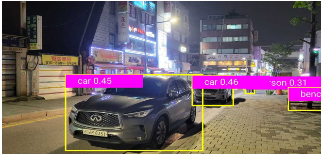
(그림 1) 객체 탐색 결과

과 Android Studio에서 수행되었다. 프로그래밍 환경으로는 PyTorch 1.10.0 및 Python 3를 사용하였다. 모델 훈련 데이터로는 roboflow 사이트에서 제공하는 Vehicles-OpenImages Dataset를 사용하였다.