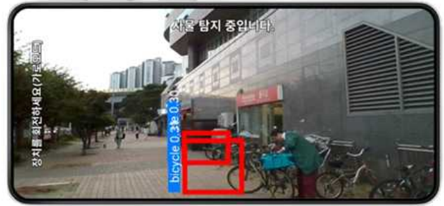
(그림 3) 애플리케이션 화면

에 대한 경고음 및 음성 안내 시스템을 구현하되 5M 이내의 물체는 안내하지 않도록 설계하였다. 이를 위해 높이와 너비가 500이 넘으면 객체를 탐지하지 않도록 하였다.