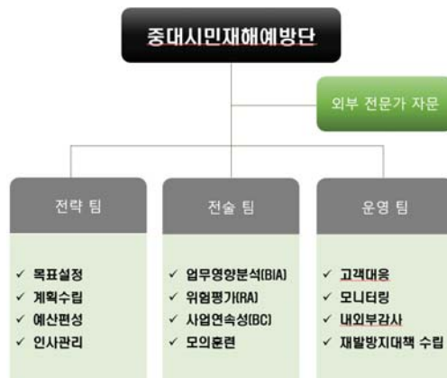
그림 . 중대시민재해예방단

그림 1과 같이 BCMS를 적용한 중대시민재해예방단의 운영관리 조직도 모델 예시이다.