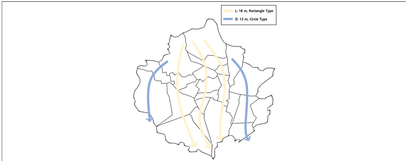
Figure 2. 그레이인프라스트럭처의 설계 concept

본 연구는 그레이인프라를 EPA SWMM 모델에 설치하기 위해 아래의 세 가지 조건을 고려하였으며, Figure 2와 같이 추가 그레이인프라를 설계하였다.