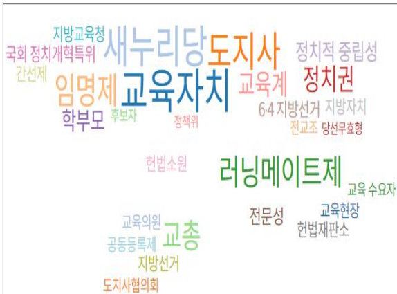
Fig. 3. Wordcloud of Associated Words (Data Type - Article Weight)

먼저, 데이터유형을 가중치로 설정하여 분석한 연관어의 워드클라우드드는 Fig. 3과 같다.