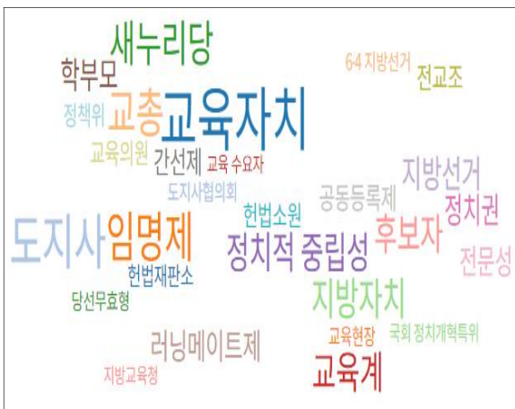
Fig. 4. Wordcloud of Associated Words (Data type - number of articles)

둘째, 데이터유형-기사 건수로 설정한 연관어의 워드클라우드드는 Fig. 4와 같다.