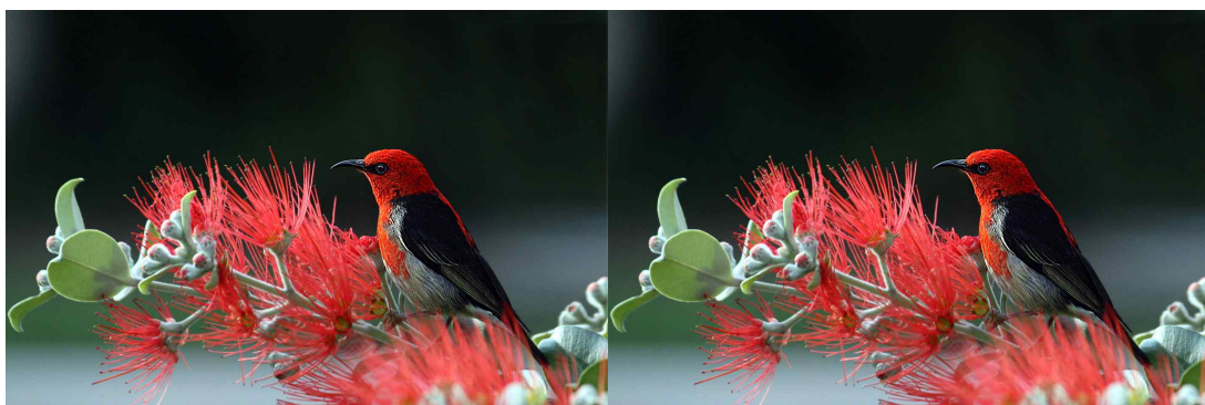
그림 2. 기존 방법과 제안한 방법의 복원 영상 비교

본 논문에서는 심층 신경망 기반 블록 단위 이미지 압축 방법을 제안하였다. 본 논문에서 제안하는 방법은 압축의 처리 단위를 블록 단위로 수행하는 것이다. 메모리의 사용량을 4K 이미지를 통해서 측정한 결과, 기존 방법대비 약 500배 적은 메모리 사용을 보였다. 따라서, 본 논문에서 제안한 블록 단위의 신경망 기반 이미지 압축 방법은 E2EIC와 복원 영상의 관점에서 동일한 압축 성능을 보임과 동시에, 이미지의 크