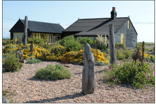
Figure 2. Derek Jarman's garden 1