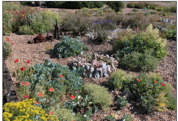
Figure 3. Derek Jarman's garden 2

그는 정원으로 자신과 사회간의 투쟁도 은유했다. 동성애자 권리 활동가라는 데릭 저먼을 바라보는 당시 사회의 시선은 결코 따뜻하지 못했다. 특히 그가 에이즈를 공개한 1986년은 매우 힘든 시기였다. 그의 정원 곳곳에 투쟁을 주제로 한 은유가 표현되어 있다는 사실에서 우리는 당시 그의 심정을 읽을 수가 있다. 데릭 저먼의 수필집과 시에서 정원의 돌은 에이버리에 있는 스톤헨지(Evebury Stonehenge)의 파워를 상징하고 있고, 그리스 신화의 무장한 전사를 상징하는 “용의 이빨” 의미도 부여했다. 그리스 신화 Phoenician prince Cadmus와 Jason's quest for the Golden Fleece에서 용의 이빨의 의미가 뚜렷이 나타난다. 용은 이빨을 심어주면 무장한 전사가 된다. 데릭 저먼은 시에서 이렇게 표현했다: “해변에 있는 정원에서 나는 내 용의 이빨의 화원을 만들었고, 현관에서 견고한 전사들을 보위하며, 끝까지 자신들의 부정행위에 항의하는 사람들에 반항하였다.” 데릭 저먼은 이러한 정원활동을 통해 자신의 괴로운 심정을 위로했다(Figure 3 참조).