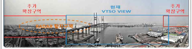
서해대교 내항 및 자동차부두 CCTV 신설 후 예상 VIEW