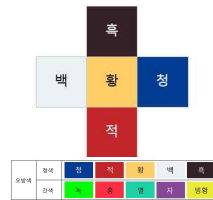
▶▶ 그림2. 오방색(정색과 간색)

〈예기·옥조(禮記·玉藻)〉에서는 '정이란 청적황백흑색의 오방 정색을 말한다. 정이 아닌 것, 즉 녹홍벽자빙황색은 오방 간색이라 한다.(正,謂靑赤黃白黑,五方正色 °不正,謂綠紅碧紫駝黃,五方間色)' 라고 기록하고 있다.[2]