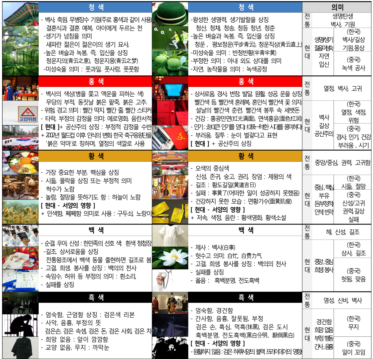
표 2. 한국의 오방색의 상징성

〈표 2〉는 전통과 현대에서 중국과 한국의 오방색의 상징성을 비교한 내용이다. 중국에서 홍색은 '광명, 온화, 축하, 성공, 길상'의 뜻으로 줄곧 긍정적인 의미로 발전되어왔다. 한국은 액막이와 기복 의미 외에 부정적인 인식도 있었으나, 2002년 개최된 월드컵의 '붉은악마'에서 긍정적인 의미를 지닌 열정으로 의미의 변화가 일어났음을 볼 수 있다. 이 변화는 환경의 변화에 따라 색채어의 의미에도 변화가 발생함을 보여준다. 한국에서 황색은 부정적인 의미로 사용된다. 또한 중국에서 황색의 의미에 포함된 '색정'은 한국에서는 빨간색으로 표현한다. 중국은 서양문화를 받아들이는 과정에서 황색에 '색정'이라는 함의가 만들어진 것으로, 과거의 '숭고, 신성'과 같이 긍정적인 의미에서 '퇴폐, 선정'의 부정적인 의미로 변화되었다. 이는 서양의 의미에 영향을 받아들이는 것이다. 한국에서 백색은 가장 사랑받는 색으로, 평화, 청결, 성스러움 등의 의미를 상징하고 있다. 이와는 반대로, 중국에서