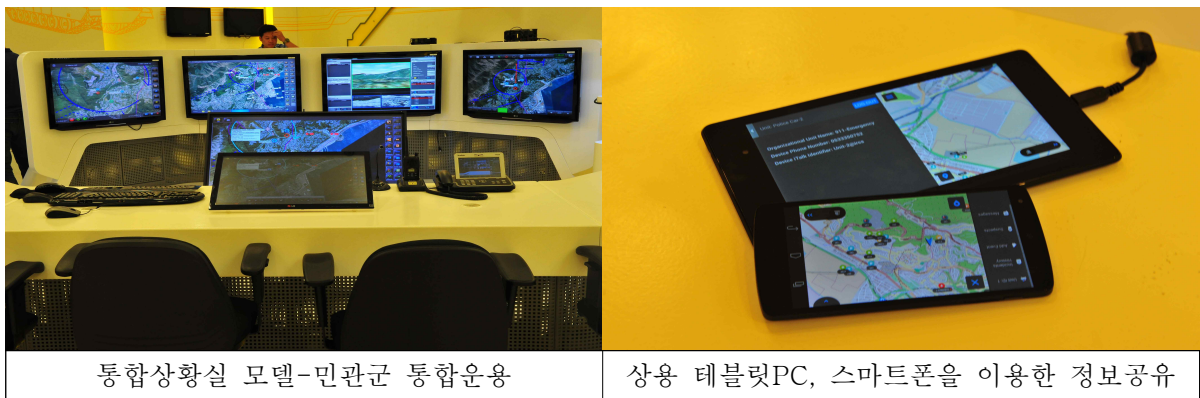
<그림2-2 이스라엘의 민관군통합지휘 시스템. Elbit systems>

따라서 생활안전분야 경찰활동에 드론이 활용된다면 신속하고 정확한 상황판단과 대처가 용이해지고 광범위한 순찰소요가 줄어들게 될 것이며 그로인한 경력의 적절한 운용과 비용절감이 기대된다.