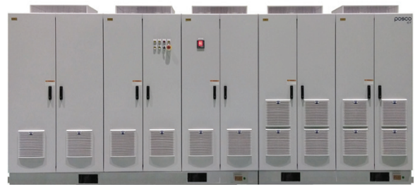
그림 1. 2MW 전력변환장치 외형

조정용 전력변환장치(PCS, Power Conditioning System)는 컨테이너 기준으로 정격용량을 4MW로 구성하며, 전력변환장치 단위 용량은 1MW 또는 2MW로 구성할 수 있다. 변전소에 적용한 전력변환장치는 단위 용량 2MW로 구성하였으며 전력변환장치의 외형은 그림 1, 상세사양은 표 1과 같다.[2]