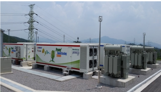
그림 3. 변전소 내 에너지 저장 장치 설치 모습

345kV 신화순 변전소에 설치된 주파수 조정용 에너지 저장 장치는 총 24MW로 6대의 컨테이너가 설치되었다. 변전소 내 설치모습은 그림 3과 같고, LPMS는 그림 4와 같이 변전소 내 운전실에 구축하였다.