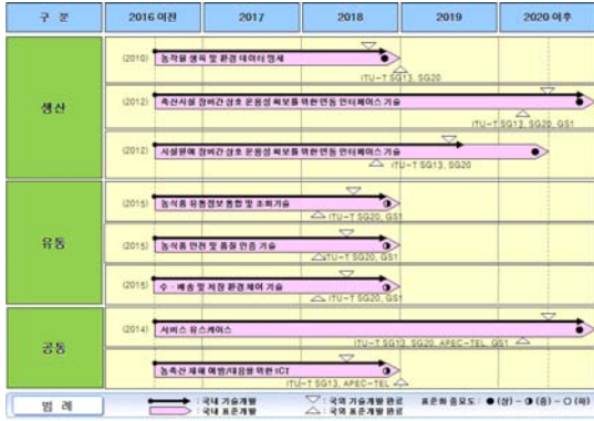
그림 3-2. 스마트 농축산업 중기 표준화 계획

2018년까지 서비스 유스케이스 및 농축산 재해 예방을 위한 ICT 요구사항 등의 정의할 예정이다.