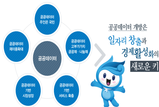
그림 2. 공공데이터의 활용

머니투데이가 서울시의 모바일 투표앱 ‘엠보팅’을 통해 조사한 결과 재난발생시 집 주변 비상대피시설에 대해 88%가 ‘모른다.’고 답했다. 집 주변 대피시설을 ‘알고 있다’는 답은 12%뿐이었다.[4] 매년 자연재해로 인한 인명피해가 발생하고 전국 곳곳에 비상상황에 대비한 지하 대피소가 2만개 넘게 지정돼 있지만 대부분 정확한 위치조차 모르고 있는 것이 현 실정이다.(그림 1)