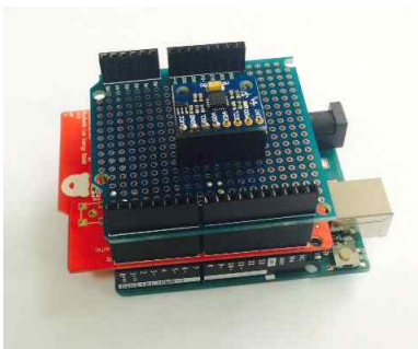
그림 3. System Hardware

그림 3의 시스템은 Arduino, BLE Shield, 센서의 순서대로 적층한 구조로 제작되었다. 그림 3의 시스템을 이용하여 피보호자의 가속도, 자이로, 지자계 정보를 측정 후 센서데이터를 보호자의 어플리케이션