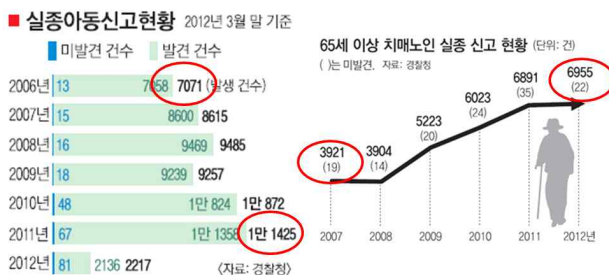
그림 1. 실종아동 및 노인 신고현황

전 세계적으로 노인인구비율이 증가하고 많은 국가가 고령화 사회가 되고 있다. 우리나라도 이미 고령화 사회로 진입하였으며 노인과 관련된 문제들이 나타나고 있다. 그 중 노인질환이 최근 이슈가 되고 있으며 특히 치매와 같은 뇌질환은 노인에게 큰 안전사고를 유발시키는 주요 질환 중 하나이다. 치매환자는 뇌기능의 저하로 인해 기억 자체를 잃어버리고 방향감각을 상실하게 된다. 이로 인해 보호자의 순간의 부주의에도 실종되는 사고가 많고, 그림 1에서 보이듯이 그 사례는 증가하고 있는 추세이다. 치매환자 이외에도 아동의 실종도 최근 증가하고 있는 추세이다. 아동의 실종신고건수는 매년 증가하고 있으며, 부모의 품으로 돌아가지 못한 아동의 수도 증가하고 있다. 한편, 아동 및 노약자는 위험에 대처하는 능력이 떨어지기 때문에, 일반인들에 비해 보호자의 작은 부주의에도 많은 위험에 노출된다.