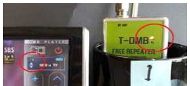
그림 5 갭 필러 파워 ON 시 T-DMB 수신상태(1번 위치)