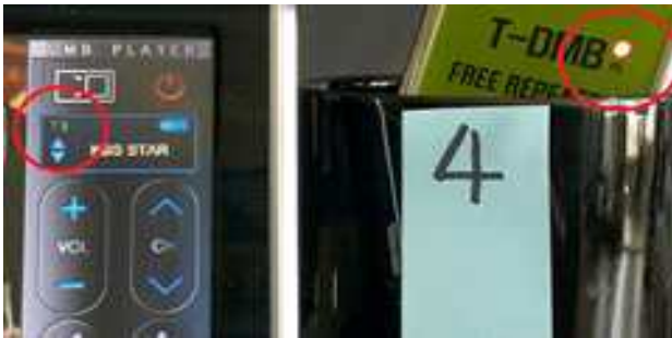
그림 7 겹 필터 파워 ON 시 T-DMB 수신상태(4번 위치)

그림 4의 경우 1번 위치에서 겹 필터 파워 OFF 시 T-DMB의 레벨미터는 눈금 5 정도로 매우 깨끗한 영상을 받아볼 수 있었다. 반면에 그림 5와 같이 겹 필터의 파워 ON시 T-DMB의 레벨 미터는 눈금 1 수준으로 오히려 크게 떨어지는 현상을 사진의 왼쪽 수신레벨 눈금으로 확인할 수 있다.