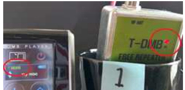
그림 10 겹 필터 파워 ON 시 T-DMB 수신상태(1번위치)