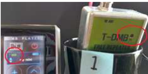
그림 9 겹 필터 파워 OFF 시 T-DMB 수신상태(1번 위치)

앞에서 보여준 현상이 Feedback 현상 때문에 발생하는 것인지 다시 확인하는 차원에서 이번에는 그림 8과 같이 수신 안테나를 창가에 격리시키고, 안테나선을 겹 필터에 연결한 후 DMB 수신기와 함께 그림 2와 같이 창가에서 실내로 이동하면서 수신레벨을 측정해 보았다.