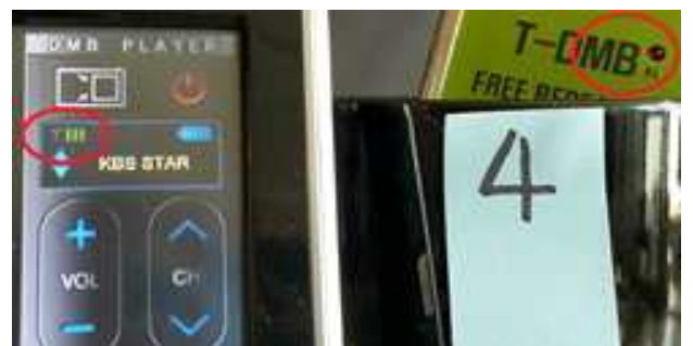
그림 6 갭 필러 파워 Off 시 T-DMB 수신상태(4번 위치)