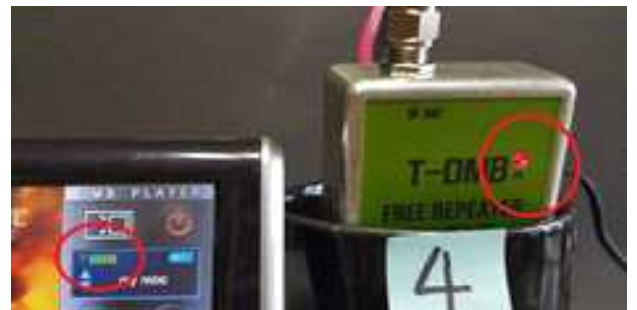
그림 12 겹 필터 파워 ON 시 T-DMB 수신상태(4번 위치)

겹 필터의 수신과 송신 안테나를 격리시켜 사용자 앞서 보여 준 그림 5와 그림 6의 경우와 반대 현상이 나타났다. 그림 9에서 겹 필터의 파워 Off 시 수신레벨이 눈금 5 정도로 좋았지만, 그림 10처럼 겹 필터의 파워를 ON 시키자 수신레벨이 눈금 6으로 더욱 좋아졌다. 또 그림 11과 그림 12와 같이 4번 위치에서도 겹 필터의 파워를 켜자 눈금 1로 동영상 수신이 안 되던 T-DMB가 겹 필터의 파워를 ON 시키자 바로 눈금 6까지 올라가는 현상을 보였다.