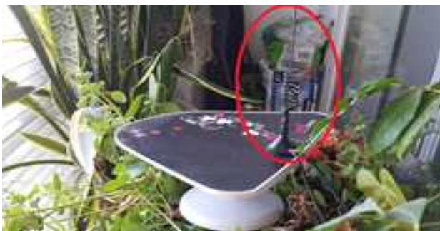
그림 8 겹 필터의 수신안테나를 창가에 격리시킨 사진

이처럼 겹 필터의 파워를 ON 시 T-DMB의 수신이 어렵게 되는 현상은 그림 3과 같이 겹 필터의 수신과 송신 안테나를 같은 공간에서 사용함으로 Feedback 현상이 발생하였기 때문이라고 판단된다.