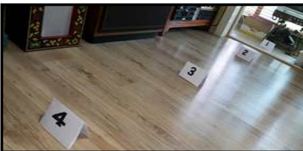
그림 2 가정용 갭 필러의 실내수신 실험 위치 표시