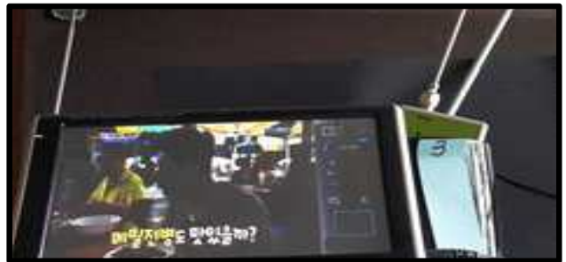
그림 3 갭 필러의 수신과 송신 안테나 동일 기기 부착 사진

이번 실험에서는 먼저 그림 3과 같이 갭 필러에 실내수신 안테나를 부착하고 그림 2와 같이 1번부터 4번 장소까지 창가에서부터 차츰 실내로 들어가면서 갭 필러 동작 유무에 따른 수신 상태를 점검하였다.