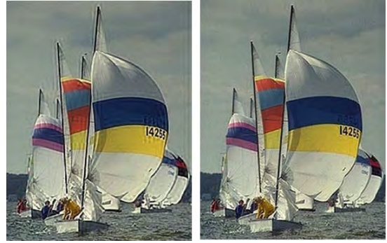
(a) (b) (그림 2) DCT 영역에서 에너지 향상 방법 비교 (a) 기존의 에너지 향상 방법, (b) 제안하는 방법

\alpha_k 는 사람의 시각 인지에 맞추어 값이 정해져야 한다. local contrast를 향상시키기 위해 우리는 중간 주파수에 대해서 강조를 하였다. 반면에 높은 주파수에 있는 noise는 감소시켰다. 그래서 \{\alpha_k\} 는 중간 주파수 대역에서 높은 값을 가지며 높은 주파수 대역에서는 작은 값을 가진다.