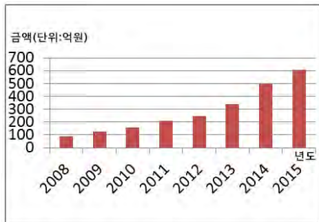
표-1 (2008-2015)각 년도 상반기(1-6 월)의 게임 시장 판매수익 교모(단위:억원)

<표-2>는 게임 종류 중에서 실제 판매 중 수익을 나타낸 것으로써, PC 클라이언트 게임은 267.1억원 (약 43억 달러)이며, 전년 동기와 대비하여 4.5% 성장하였고, 웹 게임은 102.8억원(약 16억 달러)이며, 동기와 대비하여 12% 성장하였다. 특히 모바일 게임은 209.3억원(약 32억 달러)이며, 전년 동기와 대비하여 67.2% 성장한 것을 알 수 있다. 또한, 중국 모바일 게임실제 판매 수익은 매년 1/3 씩 계속 증가하고 있기 때문에 중국 모바일 게임시장은 매우 큰 잠재력이 큰 것을 알 수 있다.