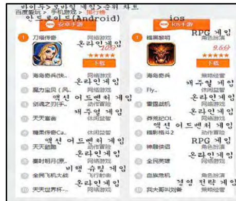
그림-1 인기 게임 순위

바이두 아이우안 사이트[3]에 나온 모바일 게임 순위 차트는 (그림-1)과 같다.