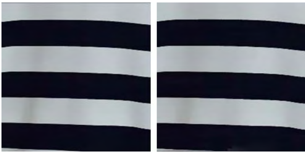
(그림 2) Bilateral 필터를 적용한 이미지(왼쪽), Bilateral 필터와 Mean-Shift 알고리즘을 적용한 이미지(오른쪽)