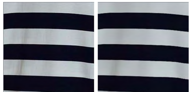
(그림 1) 원본이미지(왼쪽), Bilateral Filter를 적용한 이미지(오른쪽)

적인 방법으로 컬러 정보를 기반으로 주변의 값들과의 평균을 계산하여 중심 모드를 찾기 위한 비매개 변수적방법이다[4]. 그림 2의 오른쪽 사진은 Bilateral 필터와 Mean-Shift 알고리즘을 함께 적용한 영상이다. 원본사진과 비교해보면 두 필터를 적용한 영상은 빛의 영향과 구김에 의한 영향이 상당히 제거된 것을 확인할 수 있다.