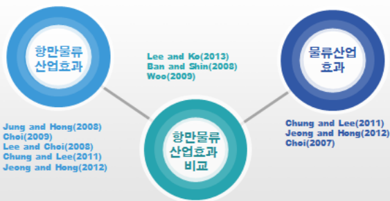
항만물류산업이 항만도시의 경제에 미치는 영향 분석