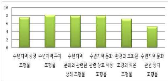
표 1. 수변지역 조형물의 특징적 속성 조사

수변지역 조형물의 특징적 속성 조사는 모든 문제점에 대해 5등급(희망적, 비교적 희망적, 불명확, 다소 희망적, 절망적)으로 나누고 점수 환산치도 각각 1~5로 나누는데 점수 환산치가 높을수록 대중의 만족도가 높음을 나타낸다. 평균치에 따라서 1. 수변지역 주제 조형물(8.13), 2. 수변지역 문화와 관련된 생태 조형물(7.93), 3. 수변지역 문화 관련 상호 작용 조형물(7.93), 4. 수변지역 상징 조형물(7.47), 5. 환경과 조화된 조경의 작은 조형물(7.12), 6. 수변지역 문화 관련 장치 조형물(5.23)로 주요순위가 정해진다. 위의 [표1]에서 수변지역 주제성 환경조형물이 대중에게 가장 많은 선택을 받았고, 수변지역 문화 관련 장치 환경조형물에 대해서는 대중이 그다지 관심이 없다는 것을 알 수 있다. 생태적 성격과 상호 작용적 성격의 환경조형물도 대중들이 좋아하기 때문에 디자인 할 때 중시 되어야 한다.