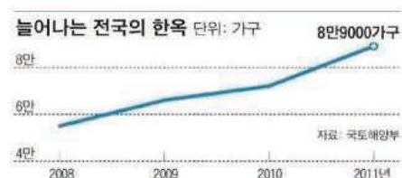
그림 2. 한옥 건축시장 추이