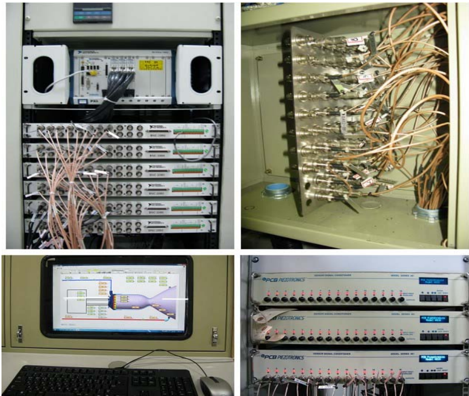
Fig. 1 Hardware of High-Frequency Data Acquisition System