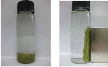
Fig. 2. Photographs of AMP/Iron oxides-PAN in the presence of the neodymium permanent magnet.

mmol/g, 세슘의 최대흡착량은 0.655 mmol/g으로 세슘의 최대흡착량이 가장 높게 나타났다.