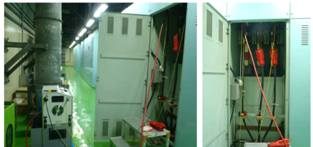
<그림 2> VLF 장비를 사용한 케이블 Tan δ 측정

케이블의 Tanδ 측정은 BAUR社 Viola TD 장비를 사용하였으며, 단락전류 문제와 절연내역이 내압크기보다 클 경우 발생하는 전동기 절연과피 문제를 우려하여 측정케이블을 모두 전동기에서부터 분리하여 측정하였다. 그리고 현장에 설치된 케이블의 특성 상 가드링 작용에 따른 말단 누설전류를 제거할 수 없기 때문에 가드링을 사용하지 않은 채 가압하여 측정하였다. 그림 2는 VLF 장비를 사용한 케이블 Tanδ 측정 상황을 나타낸 것이다.