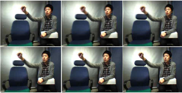
그림 4. 해상도 상향 변환 된 깊이 영상을 이용한 중간 시점 합성 결과