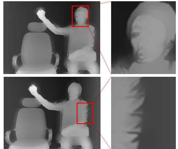
그림 1. 좌, 우 영상에 해당되는 시점 간 일관성이 고려되지 않은 해상도 상황변환 된 깊이 영상

식 (2) 에서 Range kernel 은 각 시점에서의 컬러 영상 정보를 모두 포함한다. 본 논문에서는 두 개의 시점을 사용하므로 좌, 우영상으로 Range kernel을 구성하였다. 사용가능한 컬러 영상 정보를 모두 활용하여 시점 간 일관성을 유지시킬 수 있다. 변수 t 는 반복 수행 횟수를 의미한다. 반복 수행한 결과와 이전 결과 값의 차이가 한계치를 넘는다면 그 픽셀에서의 값은 잘못 필터링 된 값, 즉 세부 텍스처가 표현되는 영역으로 판단하여 이전 결과의 값을 다음 반복 수행에서 그대로 사용한다. 한계치를 넘지 않는다면, 경계를 보존하고 평활한 영역을 더욱 부드럽게 하는 JBU 의 성능에 맞게 필터링 된 값이라고 판단하여 다음 반복 수행에서 필터링 값을 사용한다. 이러한 픽셀별 선택적 반복 수행을 통해 각 시점 간의 일관성이 유지되는 고해상도 깊이 영상을 획득할 수 있다.