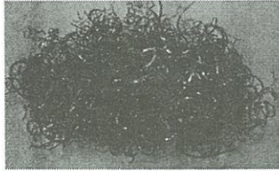
Fig. 3. U-전착물 Surrogate

Scale Hopper에 이송된 U 전착물의 중량을 계량한 후 그림 2에 나타낸 Magnetic feeder를 이용하여 U 전착물을 이동시켜 U-전착물 연계 이송 장치의 성능을 평가하였다. 장치의 성능시험을 위해 U-전착물을 모사하기 위해 S.S Wire Scrape을 문쳐 만든 그림-3에 나타낸 U-전착물 Surrogate를 이용하였다.